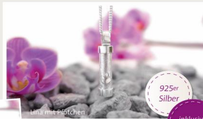
Lina mit Pfötchen