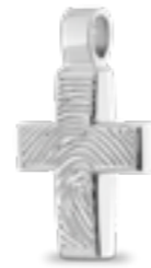
HF 114.180 Glanz H 2.4 cm