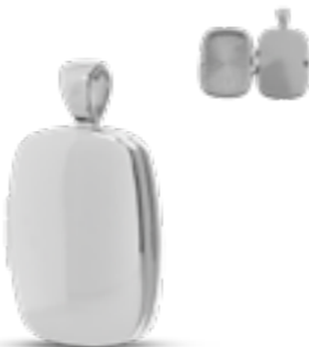
AH 050 Glanz H 3.0 cm