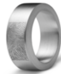
R 033.8.FPM Matt B 0.8 cm