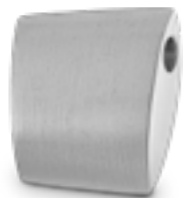
AH 004 Matt H 2.0 cm