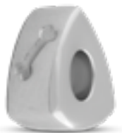
DMB 004 Glanz H 1.3 cm