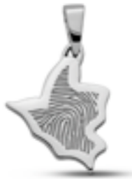
LFP 07-175 Glanz H 2.4 cm