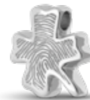
AH 061.FP Glanz H 1.9 cm