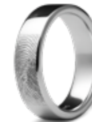
RF 02.6 Glanz B 0.6 cm