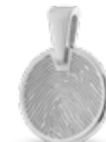
HF 108.140 Glanz H 2.0 cm