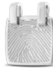
HF 116.175 Glanz H 2.1 cm