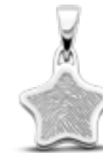
LFP 05-150 Glanz H 2.0 cm