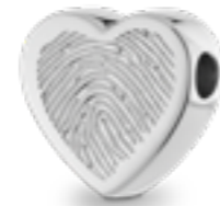
AH 053.FP Glanz H 1.6 cm