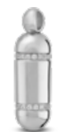
AH 119 Glanz H 2.9 cm In Silber mit Zirkonia, in Gold mit Diamanten