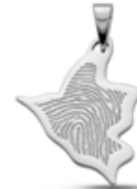
LFP 07-220 Glanz H 2.9 cm