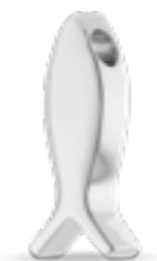
AH 055 Glanz H 2.7 cm.