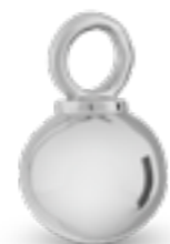
DH 006 Glanz H 1,7 cm