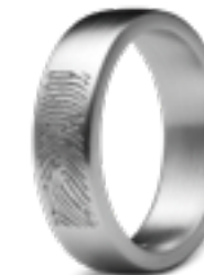
RF 02.6M Matt B 0.6 cm