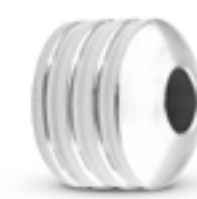
MB 008 Glanz H 1.3 cm