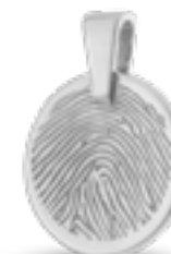
HF 108.160 Glanz H 2.1 cm