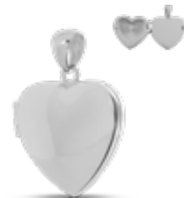
AH 049 Glanz H 2.8 cm