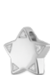
AH 079 Glanz H 1.6 cm In Silber mit Zirkonia, in Gold mit Diamanten