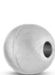
AH 076 Matt H 1.8 cm