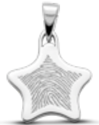
LFP 05-190 Glanz H 2.3 cm