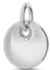
AH 001 Glanz H 2.8 cm