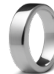
R 033.6 Glanz B 0.6 cm