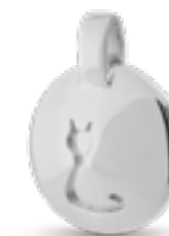
DH 200 Glanz H 2,2 cm