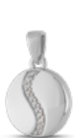
AH 071 Glanz H 2.5 cm In Silber mit Zirkonia, in Gold mit Diamanten