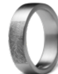
RF 02.8M Matt B 0.8 cm