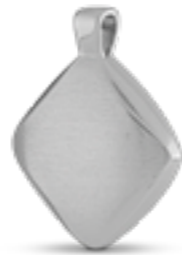
AH 122 Matt H 2,5 cm