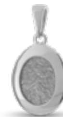
HF 104 Glanz H 2.5 cm