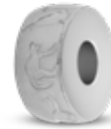
DMB 001 Glanz H 1.4 cm