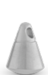
AH 118 Matt H 1.8 cm