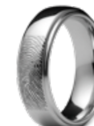
RF 05.6 Glanz B 0.6 cm