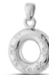
DH 018 Glanz H 2,5 cm