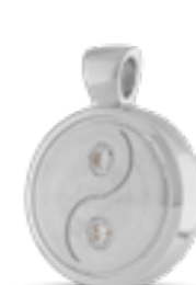
AH 112 Matt H 2.3 cm DUO - 2 Aschekammern In Silber mit Zirkonia, in Gold mit Diamanten