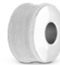
MB 002 Matt H 1.4 cm