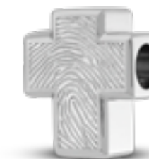
MB 006.FP Matt H 1.7 cm