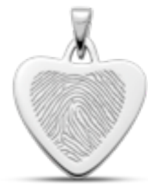
LFP 06-230 Glanz H 2.7 cm