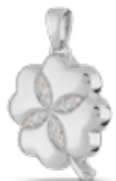
AH 077 Glanz H 2.9 cm In Silber mit Zirkonia, in Gold mit Diamanten