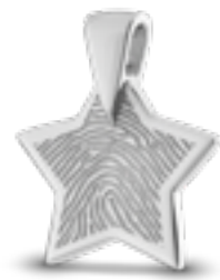
HF 110.185 Glanz H 2.3 cm