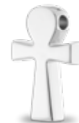
AH 056 Glanz H 2.8 cm