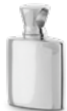
AH 062 Glanz H 2.1 cm