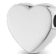
AH 053 Glanz H 1.6 cm