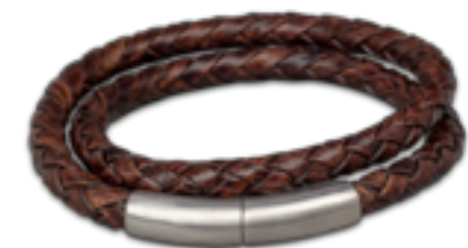
FPU 606 Matt Verfügbare Längen: S - M - L - XL