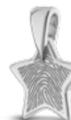
HF 110.160 Glanz H 2.0 cm