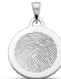
LFP 01-230 Glanz H 2.7 cm