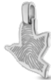
HF 111.190 Glanz H 2.4 cm