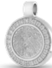
HF 100 Glanz H 2.4 cm In Silber mit Zirkonia, in Gold mit Diamanten