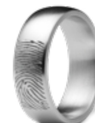
RF 04.7M Matt B 0.7 cm