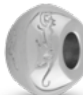
DMB 005 Glanz H 1.4 cm