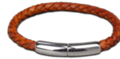
FPU 603 Glanz Verfügbare Längen: S - M - L - XL