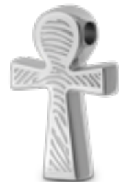
AH 056.FP Glanz H 2.8 cm