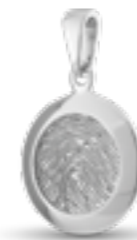
HF 103 Glanz H 2.5 cm