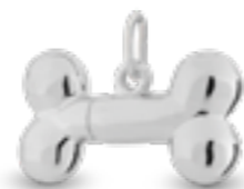
DH 005 Glanz H 1,6 cm