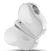
AH 060 Glanz H 2.0 cm