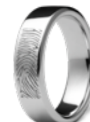
RF 02.8 Glanz B 0.8 cm