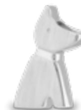
DH 017 Matt H 2,1 cm