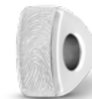
MB 004.FP Matt H 1.3 cm