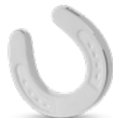
DH 009 Matt H 2,5 cm