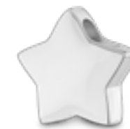
AH 054 Glanz H 1.6 cm