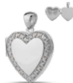
AH 048 Glanz H 2.8 cm In Silber mit Zirkonia, in Gold mit Diamanten