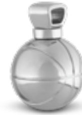
AH 152 Glanz Basketball H 2.2 cm