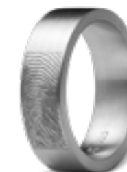
RF 03.6M Matt B 0.6 cm