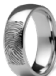
RF 04.7 Glanz B 0.7 cm