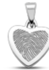
LFP 06-155 Glanz H 2.0 cm