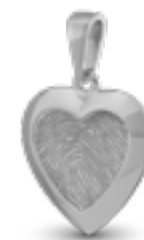
HF 105 Glanz H 2.5 cm