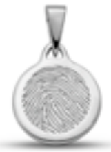
LFP 01-155 Glanz H 2.1 cm