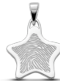
LFP 05-220 Glanz H 2.7 cm