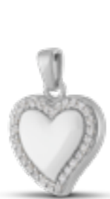
AH 073 Glanz H 2.4 cm In Silber mit Zirkonia, in Gold mit Diamanten