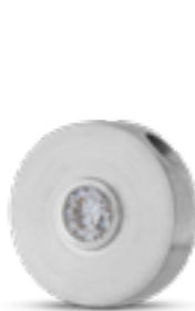
AH 075 Matt H 1.9 cm Sowohl in Silber als auch in Gold mit Zirkonia