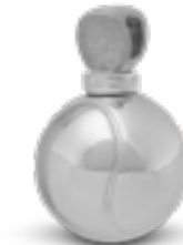
AH 155 Glanz Tennisball H 1.9 cm