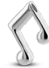
AH 172 Glanz Doppelachtel H 2.5 cm