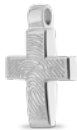
HF 114.210 Glanz H 2.7 cm