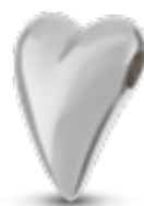
DH 008 Glanz H 1,4 cm