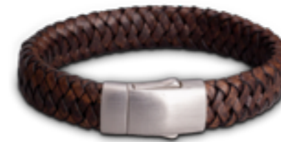
FPU 602 Matt Verfügbare Längen: S - M - L - XL