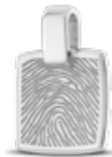
HF 116.140 Glanz H 1.9 cm