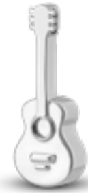
AH 173 Glanz Gitarre H 3.4 cm