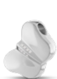
AH 083 Glanz H 2.0 cm In Silber mit Zirkonia, in Gold mit Diamanten