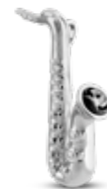
AH 178 Glanz Saxofon H 3.5 cm