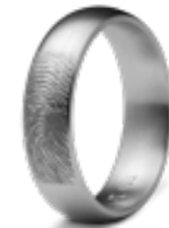
RF 01.6M Matt B 0.6 cm