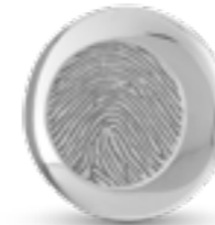
HF 095 Glanz H 1.9 cm