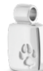
DH 208 Glanz H 2,3 cm