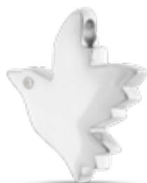
AH 082 Glanz H 2.7 cm In Silber mit Zirkonia, in Gold mit Diamanten