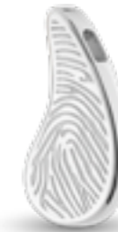
HF 117.260 Glanz H 2.6 cm