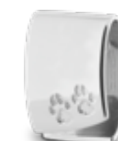
DH 209 Glanz H 1,8 cm