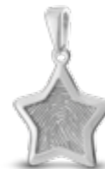
HF 106 Glanz H 2.5 cm