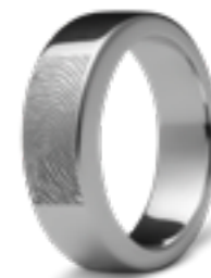
R 033.6.FP Glanz B 0.6 cm