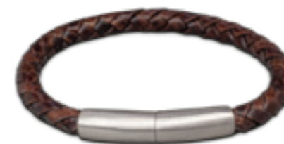
FPU 604 Matt Verfügbare Längen: S - M - L - XL