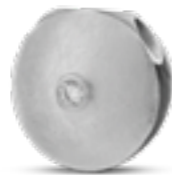
AH 011 Matt H 1.8 cm In Silber mit Zirkonia, in Gold mit Diamanten