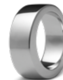
R 033.8 Glanz B 0.8 cm