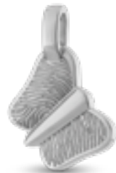
HF 112.180 Glanz H 2.5 cm