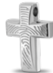
AH 057.FP Glanz H 2.6 cm