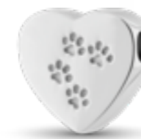
DH 205 Glanz H 1,6 cm