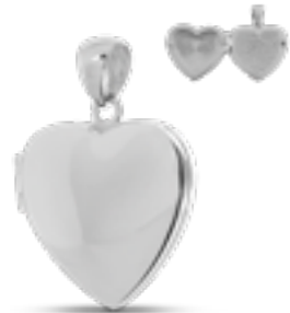
AH 049.FP Glanz H 2.8 cm