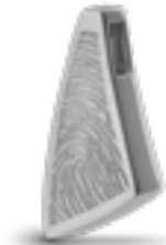
AH 065.FP Glanz H 2.2 cm