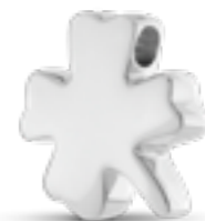
AH 061 Glanz H 1.9 cm