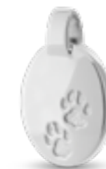
DH 202 Glanz H 2,2 cm