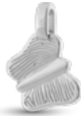
HF 112.150 Glanz H 2.1 cm