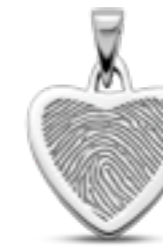
LFP 06-185 Glanz H 2.3 cm