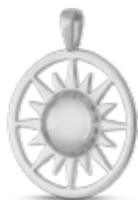
AH 072 Glanz H 3.6 cm