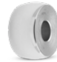
MB 009 Glanz H 1.4 cm