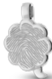
HF 115.185 Glanz H 2.7 cm