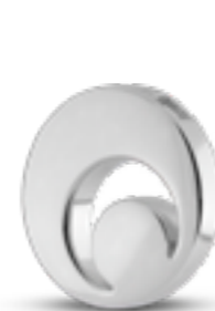
AH 088 Glanz H 2.3 cm