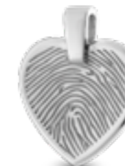
HF 109.170 Glanz H 2.1 cm