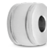
MB 007 Glanz H 1.4 cm