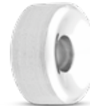
MB 003 Matt H 1.4 cm