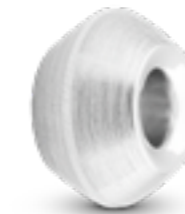
MB 001 Matt H 1.4 cm