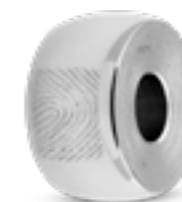
MB 009.FP Glanz H 1.4 cm