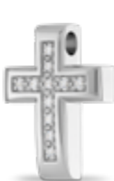
AH 081 Glanz H 2.6 cm In Silber mit Zirkonia, in Gold mit Diamanten