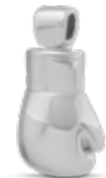
AH 157 Glanz Boxhandschuh H 2.3 cm