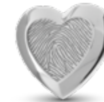
HF 097 Glanz H 1.9 cm