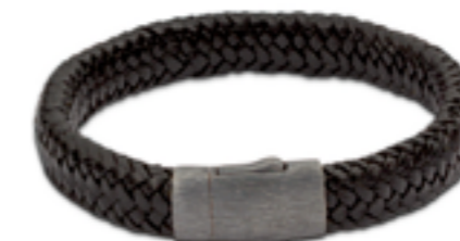
FPU 609 Matt Verfügbare Längen: S - M - L - XL