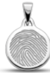
LFP 01-185 Glanz H 2.3 cm