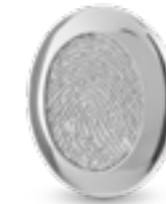
HF 096 Glanz H 1.9 cm