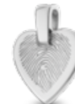
HF 109.145 Glanz H 1.8 cm