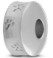
DMB 002 Matt H 1.4 cm