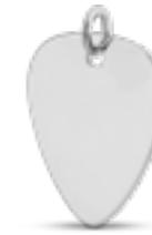
AH 176 Glanz Plektrum H 2.7 cm Schmuckstück ohne Aschekammer