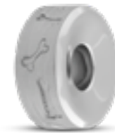
DMB 003 Matt H 1.4 cm