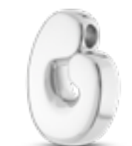
AH 058 Glanz H 2.1 cm