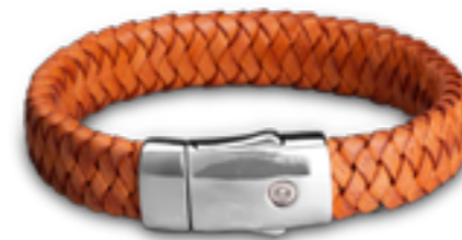
FPU 601 Glanz Mit Zirkonia. Verfügbare Längen: S - M - L - XL

Die Armbänder von die Marke Embrace sind aus echtem Leder geflochtene modische Bänder für das Handgelenk. Ein natürliches Material, das sich der Person anpasst, die es trägt. Das Leder wird mit der Zeit geschmeidiger und nimmt ein individuelles Farbgefüge an, wodurch jedes Embrace-Armband zu einem einmaligen Schmuckstück wird. Die Armbänder sind außerdem mit einem Schnappverschluss aus 925er-Sterlingsilber versehen, der die moderne Ausstrahlung dieses Schmucks zusätzlich betont. Der Verschluss enthält ferner eine kleine Aschekammer, die durch Druck sehr einfach und sicher geschlossen werden kann. Das Ergebnis ist ein stilvolles Armband, mit dem Sie Ihre Erinnerungen an einen geliebten Menschen jederzeit unauffällig bei sich tragen können.