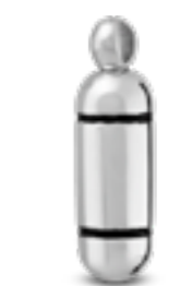
AH 120 Glanz H 2.9 cm