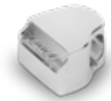
AH 177 Glanz Piano H 1.2 cm