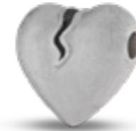
AH 126 Matt H 1,8 cm