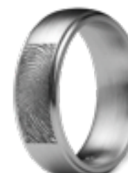
RF 05.6M Matt B 0.6 cm