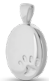
DH 004 Glanz H 3,0 cm