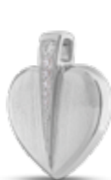
AH 085 Matt H 2.4 cm In Silber mit Zirkonia, in Gold mit Diamanten