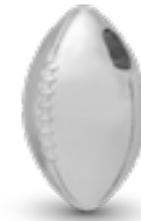
AH 151 Glanz Amerikanischer Fussball H 2.1 cm