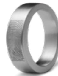
R 033.6.FPM Matt B 0.6 cm