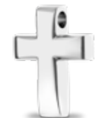
AH 057 Glanz H 2.6 cm