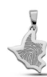
LFP 07-140 Glanz H 2.1 cm