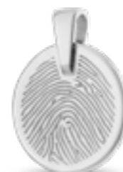
HF 108.180 Glanz H 2.2 cm