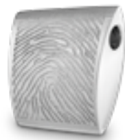
AH 004.FP Matt H 2.0 cm