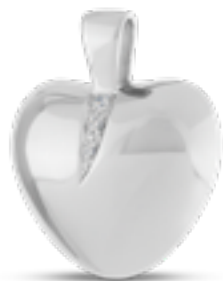
AH 070 Glanz DUO - 2 Aschekammern In Silber mit Zirkonia, in Gold mit Diamanten