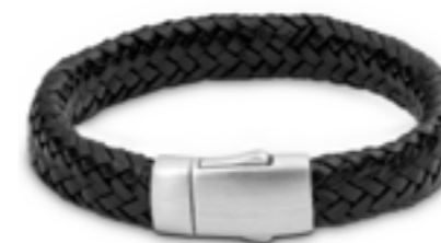
FPU 608 Matt Verfügbare Längen: S - M - L - XL