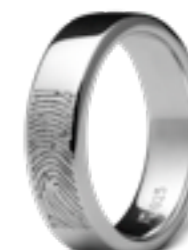
RF 03.6 Glanz B 0.6 cm