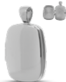
AH 050.FP Glanz H 3.0 cm