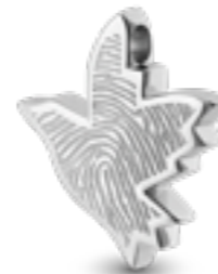
AH 059.FP Glanz H 2.7 cm