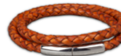
FPU 605 Glanz Verfügbare Längen: S - M - L - XL