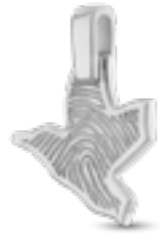
HF 111.175 Glanz H 2.2 cm