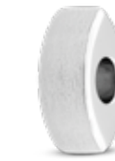
MB 005 Matt H 1.6 cm