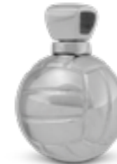
AH 154 Glanz Volleyball H 2.3 cm