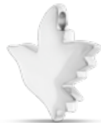
AH 059 Glanz H 2.7 cm