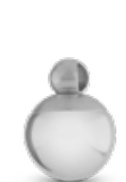
AH 117 Glanz H 1.7 cm