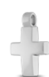
AH 116 Glanz H 2.3 cm