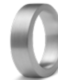
R 033.6M Matt B 0.6 cm