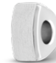
MB 004 Matt H 1.3 cm