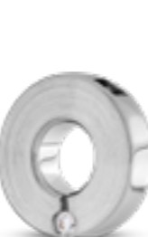
AH 086 Matt H 1.9 cm DUO - 2 Aschekammern In Silber mit Zirkonia, in Gold mit Diamanten