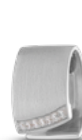
AH 089 Matt H 2.0 cm In Silber mit Zirkonia, in Gold mit Diamanten