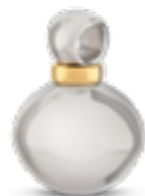
AH 043 Glanz H 2.0 cm Zierring in Gold mit 14K