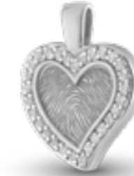
HF 101 Glanz H 2.6 cm In Silber mit Zirkonia, in Gold mit Diamanten