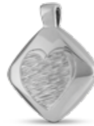
AH 123 Glanz H 2,5 cm