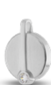
AH 087 Matt H 2.4 cm In Silber mit Zirkonia, in Gold mit Diamanten