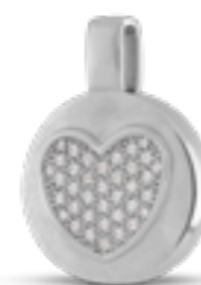
AH 111 Matt H 2.7 cm In Silber mit Zirkonia, in Gold mit Diamanten