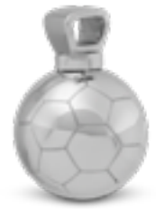
AH 153 Glanz Fussball H 2.2 cm