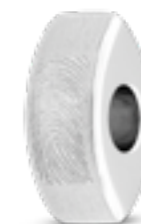
MB 005.FP Matt H 1.6 cm