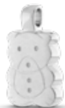
AH 067 Matt H 2.2 cm