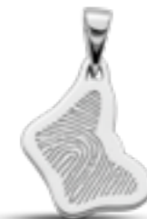
LFP 08-185 Glanz H 2.4 cm