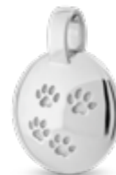
DH 201 Glanz H 2,3 cm