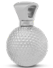
AH 156 Glanz Golfball H 1.9 cm