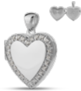
AH 048.FP Glanz H 2.8 cm In Silber mit Zirkonia, in Gold mit Diamanten