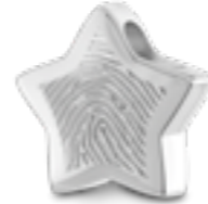
AH 054.FP Glanz H 1.6 cm