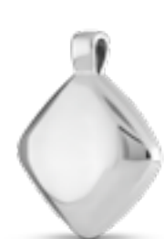
AH 121 Glanz H 2.5 cm