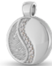
HF 099 Glanz H 2.3 cm In Silber mit Zirkonia, in Gold mit Diamanten