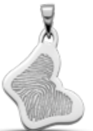
LFP 08-230 Glanz H 2.9 cm