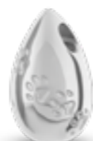
DH 207 Glanz H 1,9 cm