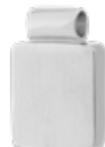
DH 011 Matt H 2,0 cm