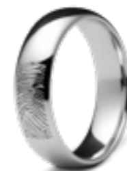
RF 01.6 Glanz B 0.6 cm

Atlantis Memorials bietet auch eine umfassende Kollektion mit Fingerabdruckschmuck ohne Aschekammer an, sowohl für Frauen als auch für Männer geeignet. Modische, elegante Ringe, die durch einen persönlichen Fingerabdruck die Lebensgeschichte eines geliebten Menschen erzählen. Der Fingerabdruck wird mit einem Speziallaser tief in das Schmuckstück eingraviert. Auf diese Weise lässt sich eine hohe für täglich getragenen Gedenkschmuck notwendige Druckqualität erzielen. Nach der Fertigbearbeitung und Fixierung wird jedes Schmuckstück außerdem nochmals versilbert oder vergoldet. Die Ringe sind in glänzender und matter Ausführung erhältlich.