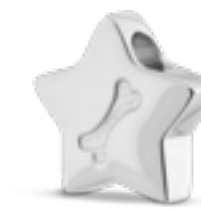
DH 206 Glanz H 1,6 cm