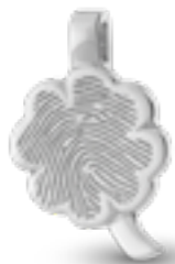
HF 115.165 Glanz H 2.4 cm