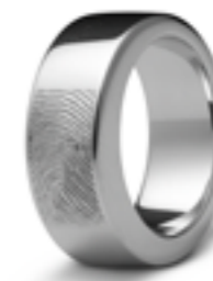
R 033.8.FP Glanz B 0.8 cm