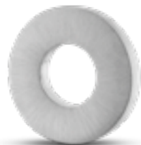
AH 040 Matt H 2.1 cm