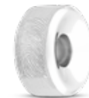
MB 003.FP Matt H 1.4 cm