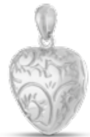
AH 069 Glanz H 2.8 cm