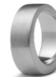
R 033.8M Matt B 0.8 cm