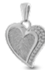
HF 102 Glanz H 2.5 cm In Silber mit Zirkonia, in Gold mit Diamanten