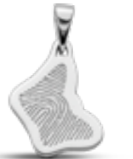
LFP 08-155 Glanz H 2.1 cm