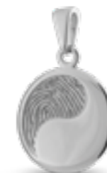
HF 107 Glanz H 2.6 cm