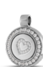
AH 093 Glanz H 2.4 cm In Silber mit Zirkonia, in Gold mit Diamanten